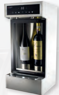
enoone Das Raumwunder

DER WEINFACHHANDEL STEHT IN IMMER GRÖßERER KONKURRENZ ZUM LEBENSMITTELEINZELHANDEL, DIE IM WEINBE- REICH MEHR UND MEHR AUFRÜSTEN. DER ETABLIERTE WEINFACHHÄNDLER KANN DIESEM WETTBEWERBSDRUCK DURCH FACHKOMPETENZ UND PERSÖNLICHER KUNDENBERATUNG ENTGEGENTRETEN – ABER AUCH DURCH INNOVATIONEN.