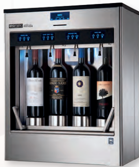
élite 4 2.5 Der Alleskönner