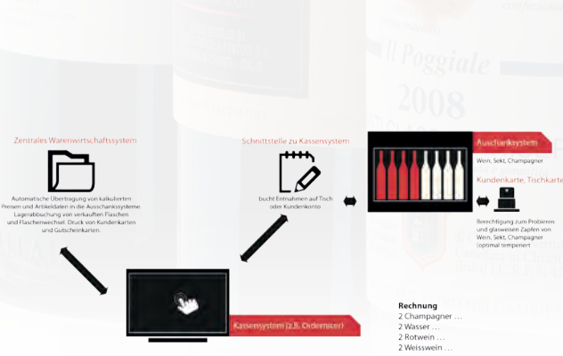
Beispiel der Kassenanbindung in der Wein-Bar