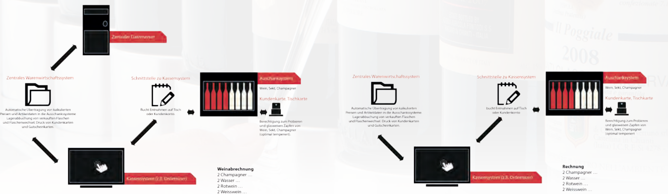
Sample cash point interface wine store

At the moment enomatic® is the only wine dispenser system which can realize a connection with nearly all cash point and merchandise information systems. We program an individual interface adapted to your individual needs and requirements. The software of enomatic® allows a comprehensive administration and evaluation of the dispensers. We would be glad to advise you.