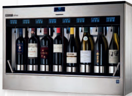
élite 8 2.5 Der Alleskönner